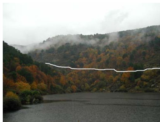
Entorno del Pajarejo desde el muro de la Presa. Marcado con un línea blanca el camino a seguir.

Seguimos por la pista asfaltada hasta la primera curva a la derecha, en este punto la abandonamos y seguimos por un camino a la izquierda que seguiremos, aproximadamente, durante 1 ½ Km. El camino va ascendiendo de forma muy suave y progresiva, alejándose verticalmente del arroyo, entre castaños, sauces, robles, escobas, cornicabras y pinos que convierten el entorno en un mar de colores.