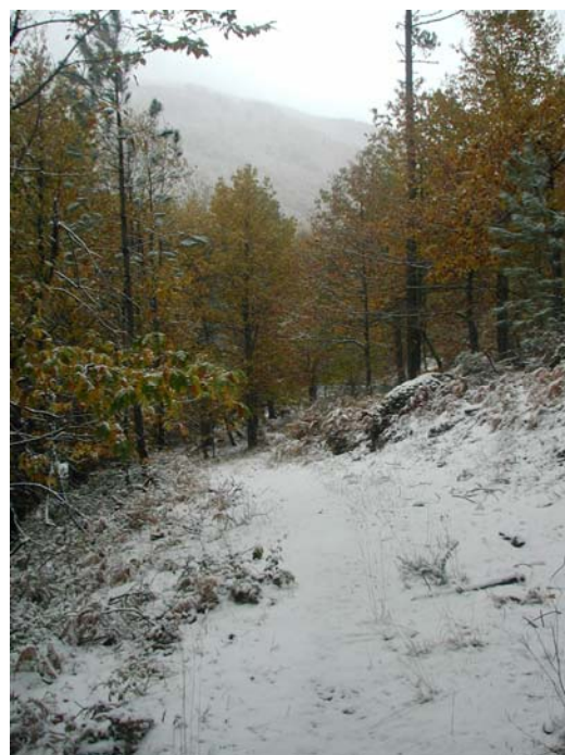
En el pinar de Santa María