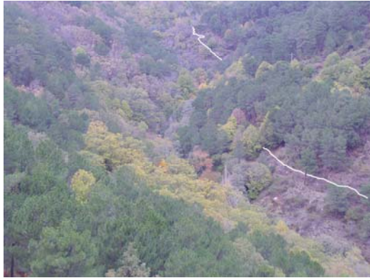
Vista parcial del camino recorrido, desde el Calamueco.

Una vez el camino, ahora convertido en pista, llega a la altura del cauce del arroyo junto a un puente, giramos a la derecha por entre pinos y algunas matas de roble que en fuerte ascensión, aunque corta, nos lleva hasta la carretera de Casillas.