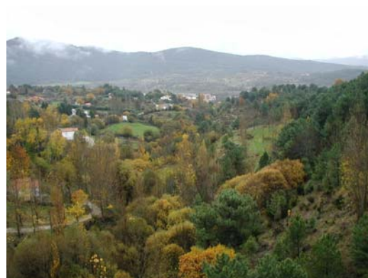
Ribera del Pajararejo.

Iniciamos este paseo en el sitio del Venero, remontando el muro de la presa del Pajarejo por su lado derecho ( pista hormigonada ), una vez arriba disfrutaremos de una espléndida panorámica de la ribera del arroyo de Pajarejo aguas abajo y del entorno de la presa.