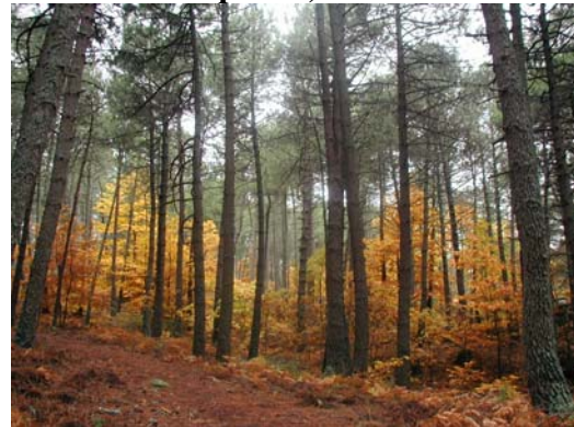
Pinar de Santa María.

atraviesan estas ( si decidimos abandonar el pinar ).