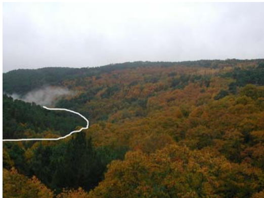
Desde la carretera a Casillas. Marcado con la línea blanca recorrido parcial del cauce del Pajarejo, donde se forma la hoz de Escarabajosa citada en el libro de monterías de Alfonso XI.

Cruzamos la carretera, dejando a la derecha a escasos 50 metros una explanada y la antigua casa del Guarda ( Era de las Coronillas ), adentrándonos en la Umbría del Pinar de Santa María.