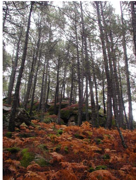
Pinar de Santa María. Abajo CAGARRIA